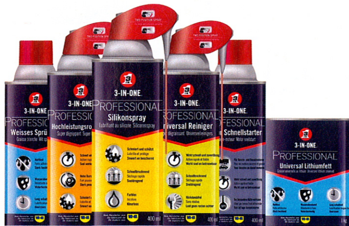
Handwerkszeug für echte Profis: 3-in-One